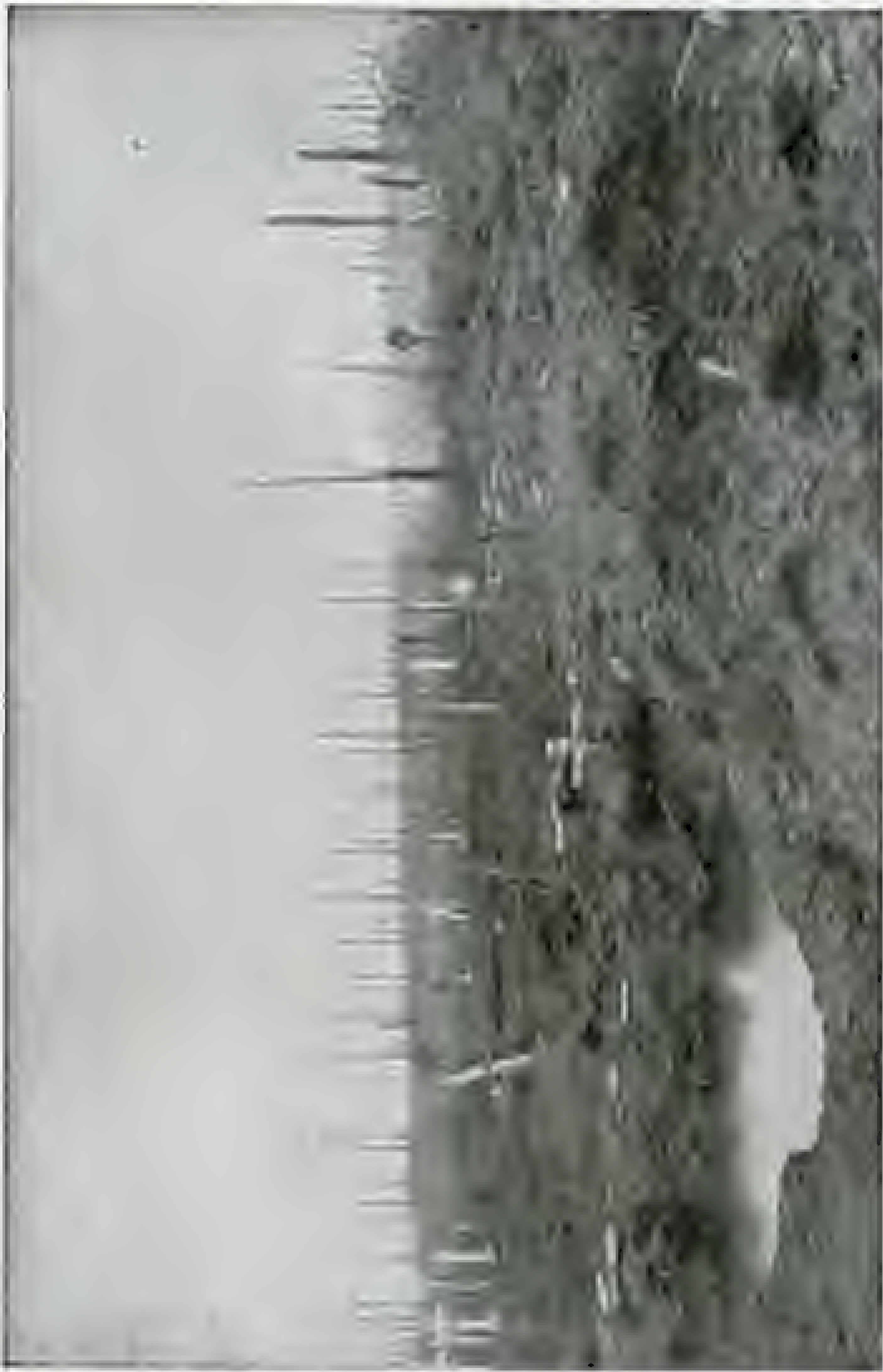
Als wir die Stellung von Wimby übernahmen...