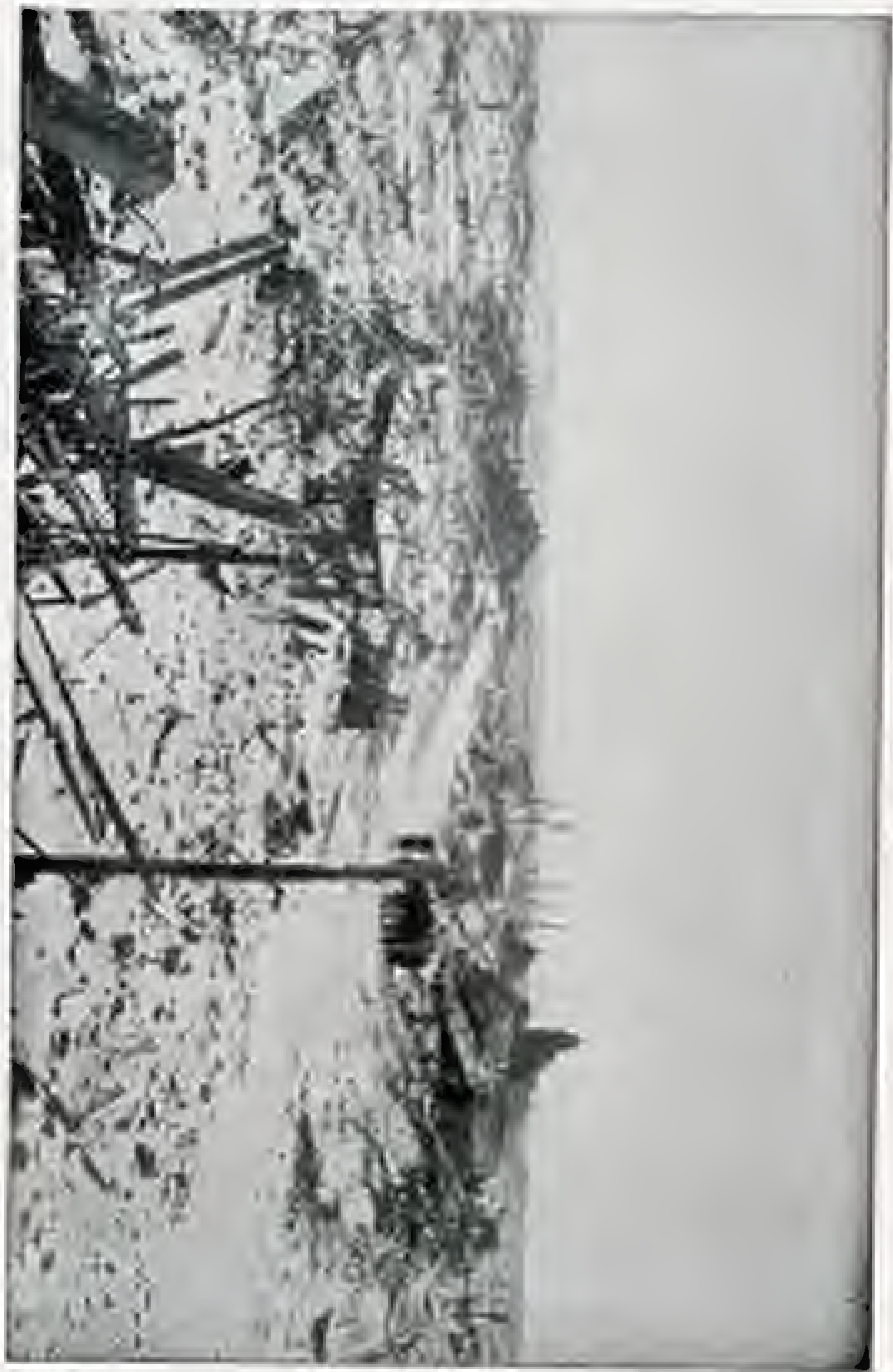
Erdbebenfeld von Nippon. Zedungesellen sind bei Arbeitseindringt.