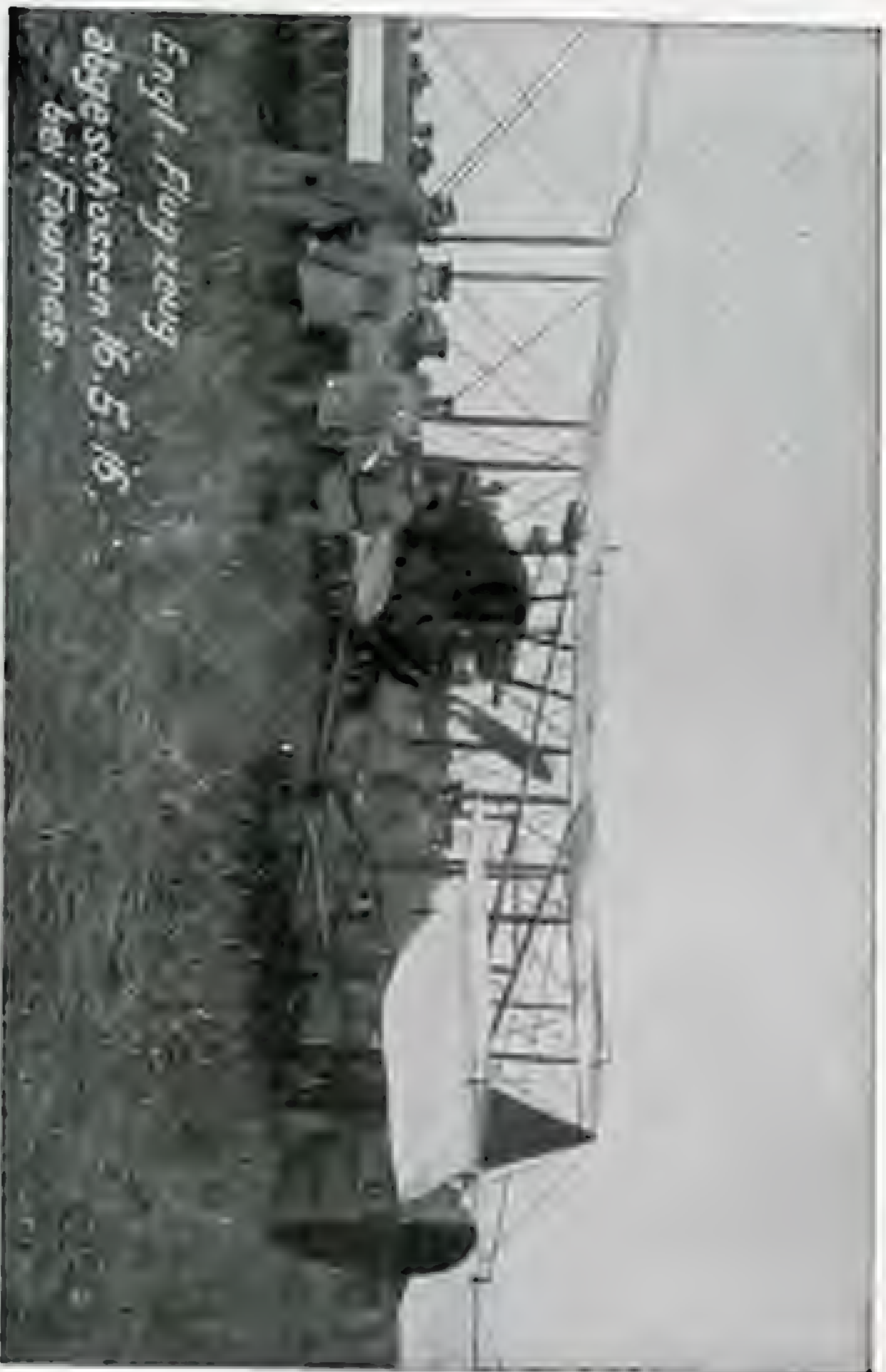
Engl. Flugzeug Abgesenossen N. 5. 185 bei Fournes.