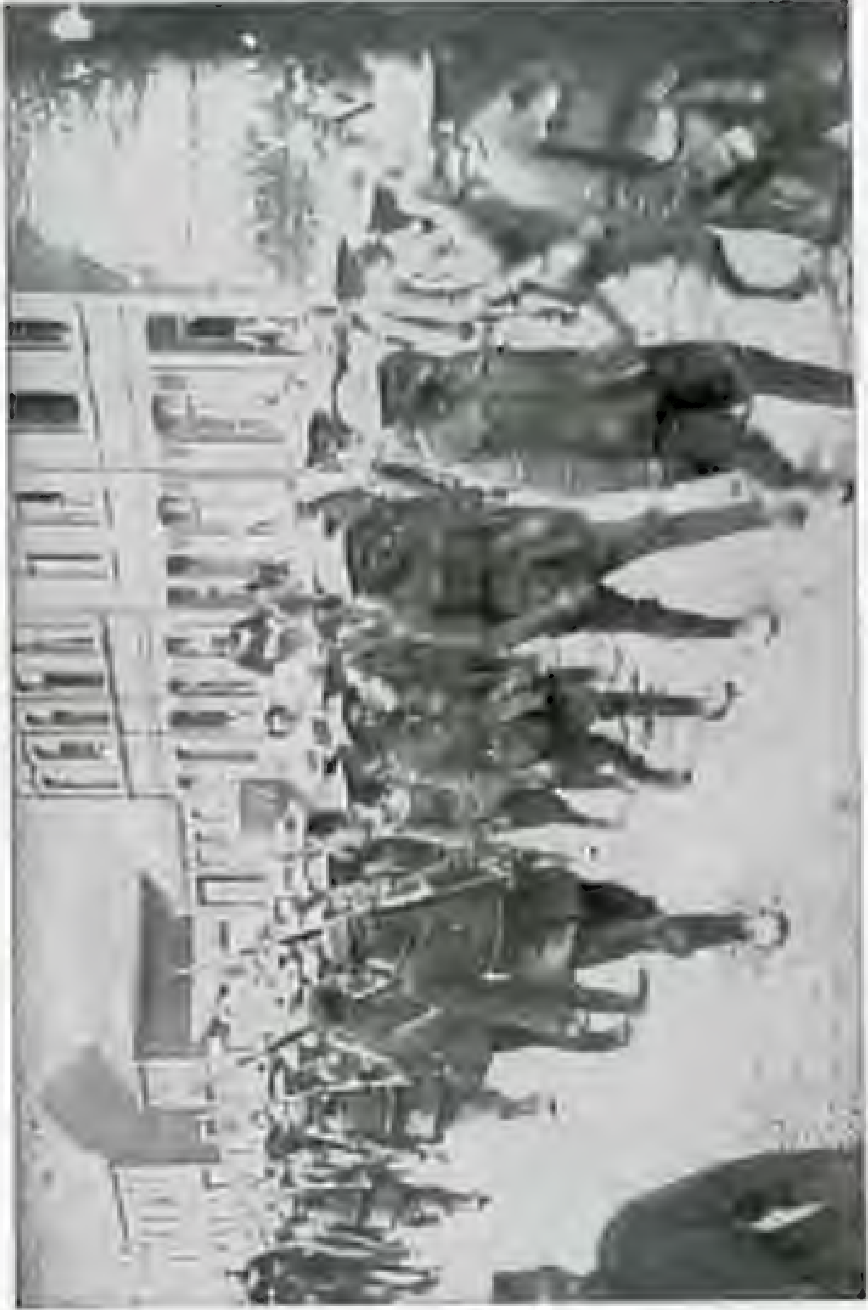
Gejangene Boimollic, noch dem verfallenen Biedel am 16. Juli 1916.