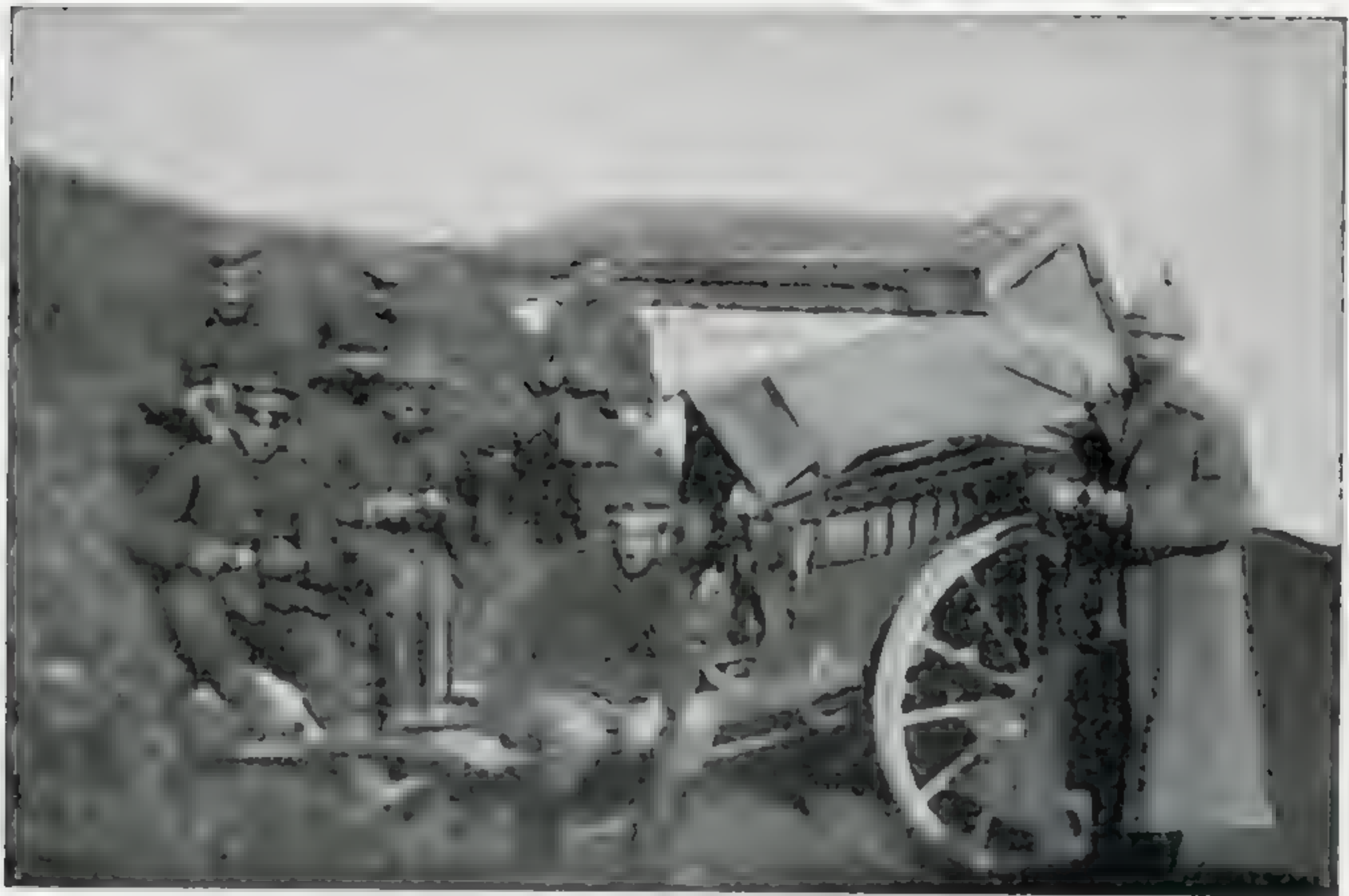
Gefechtsbagage der Meldegänger. Rast beim Vormarsch.