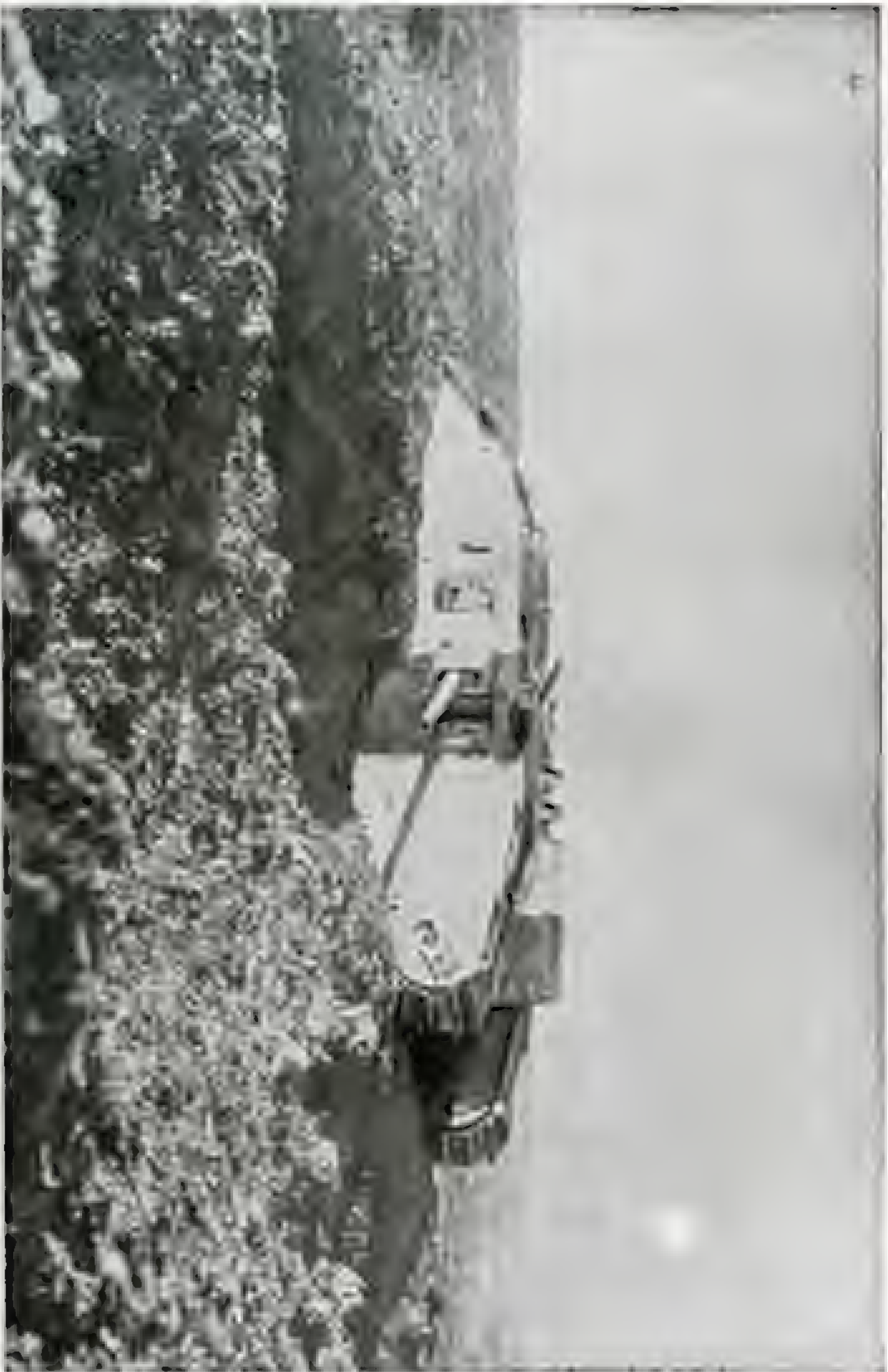
Slußer Rampi gefeßter Tanti bei Mecelaere.